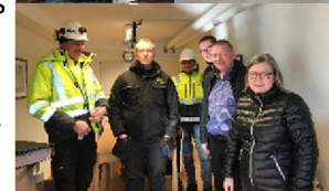
Byggmöte i vår kontorslokal

Tyvärr drabbas en del av er av tillfälliga p-platser där byggarna måste fram eller finns risk för skador på bilen. Men vi gör allt för att olägenheten skall bli så liten som möjligt och försöker hitta bästa möjliga tillfälliga lösning.