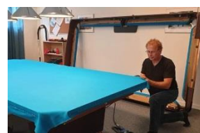
Utbyte av biljardduk